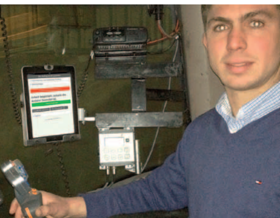
■ Lohnunternehmen Schafmeister war erster Pilotbetrieb.

Erstmals bietet nun die betriko GmbH mit Agrarmonitor eine Softwarelösung speziell für Ihr Lohnunternehmen an. Agrarmonitor wurde vom ersten Tag an in enger Kooperation mit Lohnunternehmen entwickelt und stößt in den Testbetrieben auf durchweg positive Resonanz. Agrarmonitor wurde so konzipiert, dass besondere Wünsche des Lohnunternehmers, etwa spezielle Vorlieben in der Disposition, schnell durch die betriko GmbH in das Programm integriert werden können.